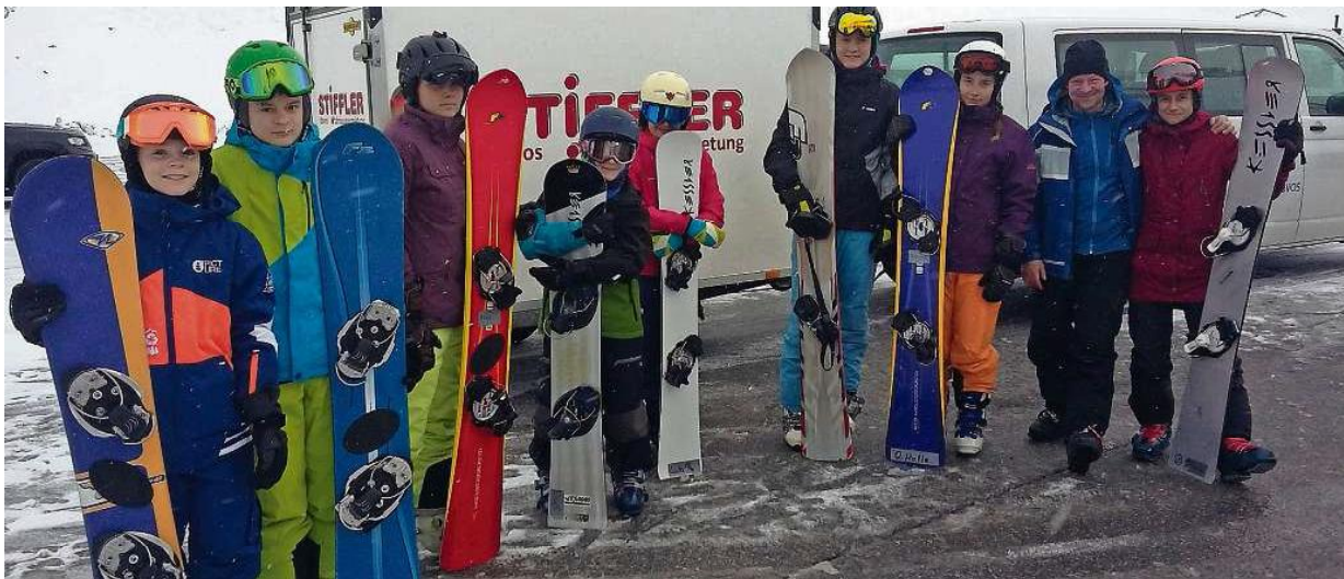
Die Renngruppe der Snowboard-JO des Skiclubs Rinerhorn während ihres Trainingslagers im österreichischen Sölden.